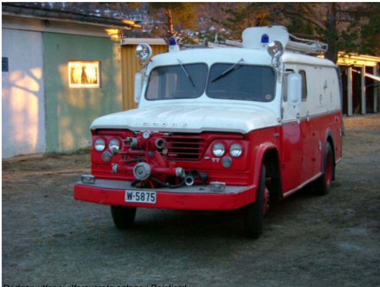
Dodgen utfor sivilforsvarets anlegg i Beisfjord.

mandag 23. mai 2011 11:26 - Sist oppdatert onsdag 25. mai 2011 20:16